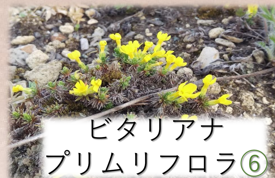
ビタリアナ プリムリフロラ⑥