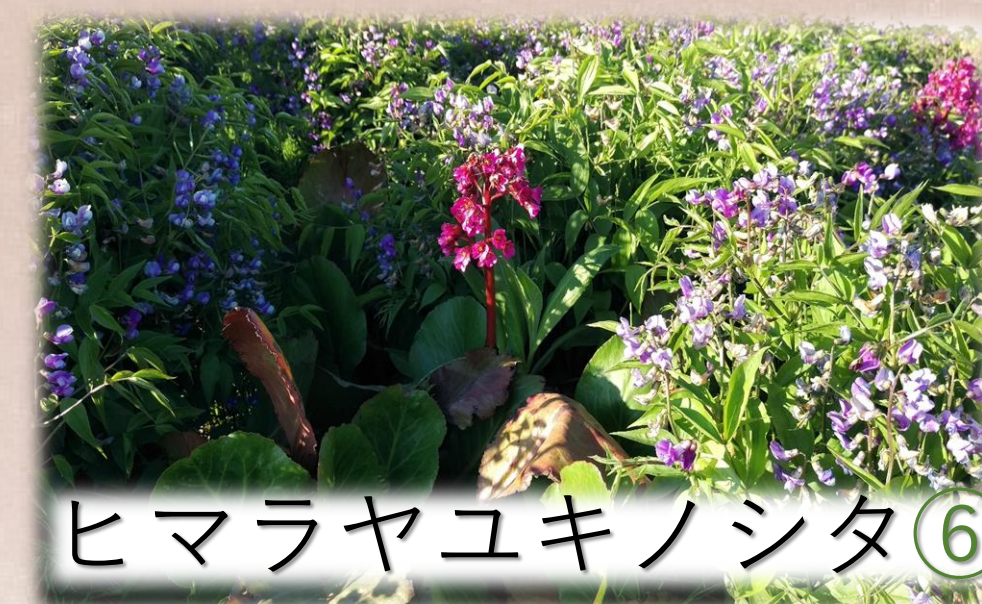
ヒマラヤユキノシタ⑥