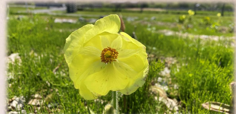
メコノプシス インテグフォリア①・④