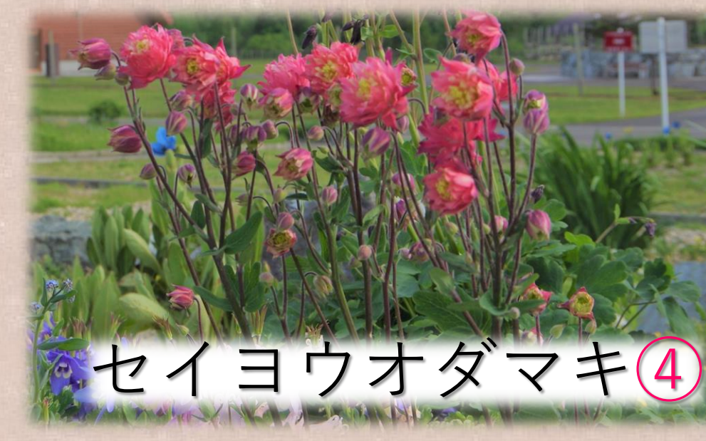
セイヨウオダマキ④