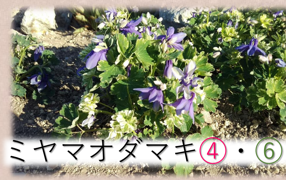
ミヤマオダマキ④・⑥