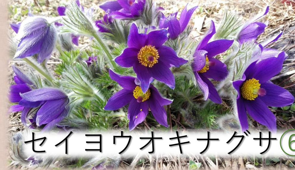
セイヨウオキナグサ⑥